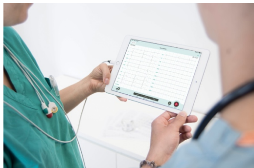
CardioSecur Pro wird von medizinischem Fachpersonal verwendet.